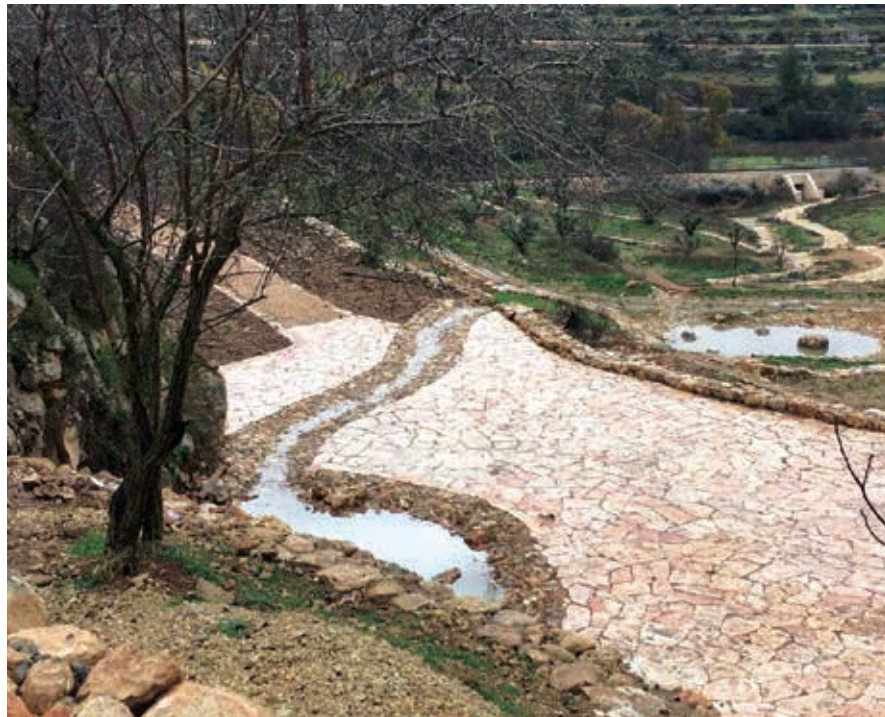
▲ עין לבן - הפארק התחתון: מערכת מפלונים, בריכות ונחל

מסעדה ומרכז לחקלאות אורגנית. מערכת המים - היוצאים מנקבה בסלע - עברה בדרך תת-קרקעית פתלתלה ולא ברורה, למבנה מפואר של נימפאון ומשם בתעלה בנויה לבריכה חקלאית גדולה.