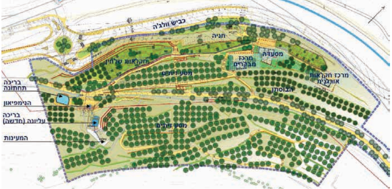
▲ עין אל חניה - תכנית