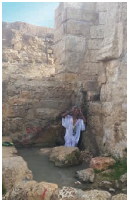
▲ עין אל חניה - האתר בשימוש מאמיני הכנסייה הארמנית, מאמיני הכנסייה האתיופית, תושבי וואלאג'ה ויהודים דתיים

החקלאיים-מסורתיים, הדתיים והחוויתיים, מספק הזדמנות פז לשילוב ושיתוף אוכלוסיות שונות ומגוונות וליצירת מוקד חינוכי ייחודי לנוף המקומי והארצי.