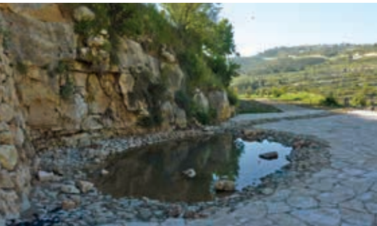
▲ עין לבן - הפארק התחתון: מפל על מצוק סלע ובריכה מרכזית