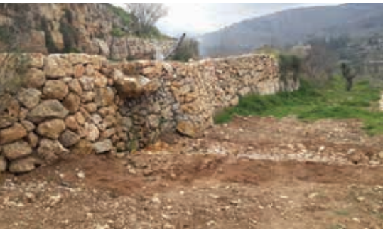
▲ עין לבן - אבני המפלונים מאבני המקום