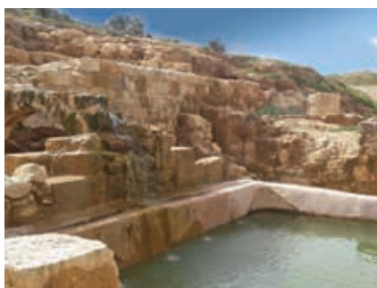
▲ הבריכה שנחשפה באזור העתיקות

החקלאיים-מסורתיים, הדתיים והחוויתיים, מספק הזדמנות פז לשילוב ושיתוף אוכלוסיות שונות ומגוונות וליצירת מוקד חינוכי ייחודי לנוף המקומי והארצי.